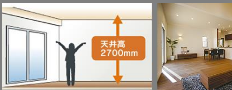
※イメージイラスト